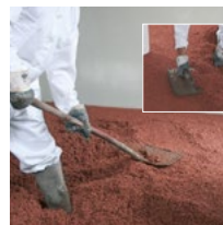
Die Anschlusskanten an der Mauer nacharbeiten und aufgetragene Fläche verdichten.