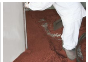
Lehren (Faschen) schütten, verdichten und auf Niveau abziehen.