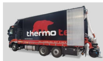
Lieferung, anmischen und pumpen erfolgt durch das thermotec® Mixmobil