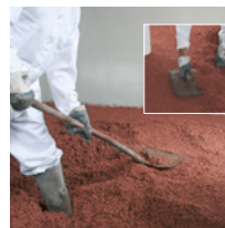
Die Anschlusskanten an der Mauer nacharbeiten und aufgetragene Fläche verdichten.