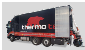
Lieferung, anmischen und pumpen erfolgt durch das thermotec® Mixmobil