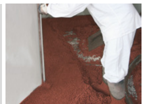
Lehren (Faschen) schütten, verdichten und auf Niveau abziehen.