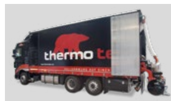
Lieferung, anmischen und pumpen erfolgt durch das thermotec® Mixmobil