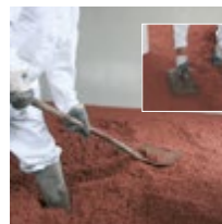
Die Anschlusskanten an der Mauer nacharbeiten und aufgetragene Fläche verdichten.