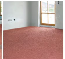
... und fertig!

Dies ist ein gelenktes Dokument und wird laufend auf Aktualität geprüft sowie unter thermotec.eu zur Verfügung gestellt. Bei Druck oder Download verliert das Datenblatt den Status als gelenktes Dokument und wird unsererseits nicht mehr überwacht. Die Aktualität ist vor Verwendung zu prüfen! Dokument ist urheberrechtlich geschützt, eine Vervielfältigung, Veröffentlichung oder Einbettung ist nicht gestattet. Bei Weitergabe an Dritte ist folgender Link https://www.thermotec.eu/downloadcenter/ zu verwenden.