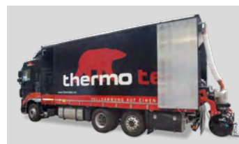
Lieferung, anmischen und pumpen erfolgt durch das thermotec® Mixmobil