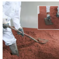
Die Anschlusskanten an der Mauer nacharbeiten und aufgetragene Fläche verdichten