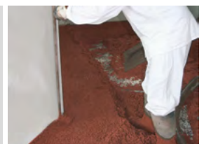
Lehren (Faschen) schütten, verdichten und auf Niveau abziehen