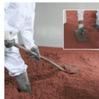
Die Anschlusskanten an der Mauer nacharbeiten und aufgetragene Fläche verdichten