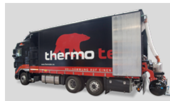
Lieferung, anmischen und pumpen erfolgt durch das thermotec® Mixmobil