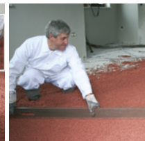
Fläche abziehen ...