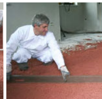
Fläche abziehen ...