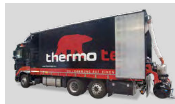
Lieferung, anmischen und pumpen erfolgt durch das thermotec® Mixmobil