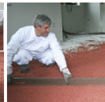
Fläche abziehen ...