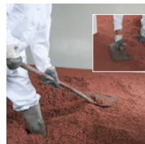
Die Anschlusskanten an der Mauer nacharbeiten und aufgetragene Fläche verdichten