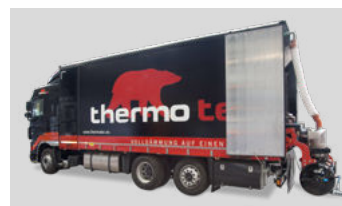
Lieferung, anmischen und pumpen erfolgt durch das thermotec® Mixmobil